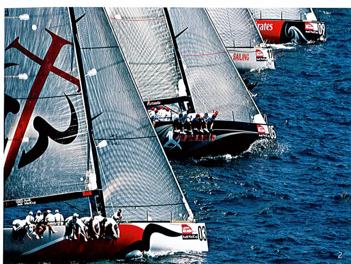
2 Audi MedCup