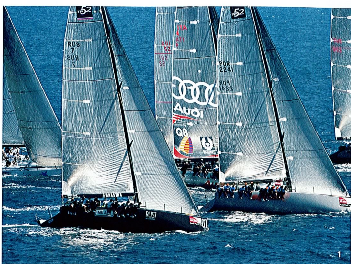
1 Audi MedCup