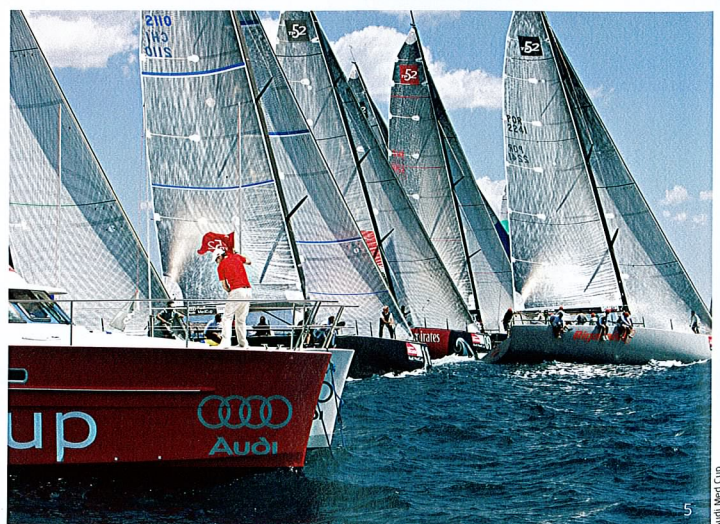
5 Audi MedCup