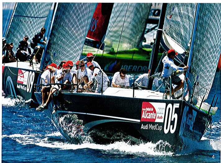
4 Audi MedCup